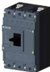
MCCB 3VJ 2P