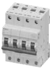
MCB 5TJ 4P