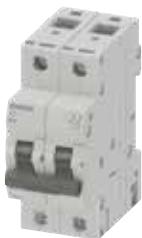
MCB 5TJ 2P