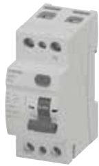
RCBO 5TJ7 2P

Bảo vệ chống dòng rò. Cần phối hợp với MCB. Tiêu chuẩn IEC 61008-1, IEC 61008-2-1