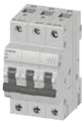
MCB 5TJ 3P