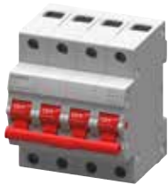
MCB 5TE3 4P